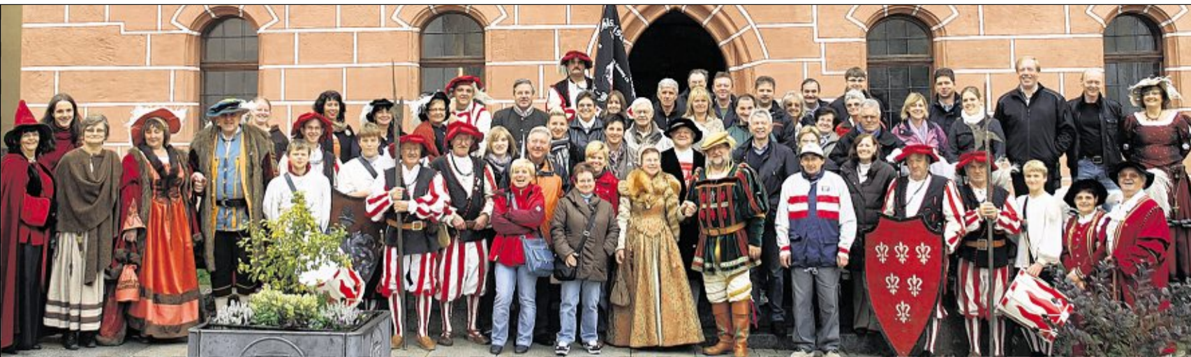
Die Gäste aus Buttenheim freuten sich ungemein über den beeindruckenden Empfang, den die Stiberer und die Stadt ihnen bereiteten.