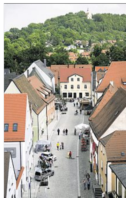
Von fern grüßt Mutter Anna und hält ihre schützende Hand auch über das sanierte Neustadt-Viertel.