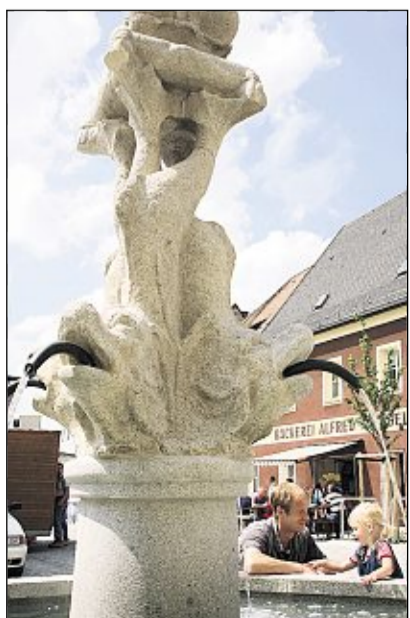
Der frühere Delfinbrunnen lädt auch zum Verweilen ein.